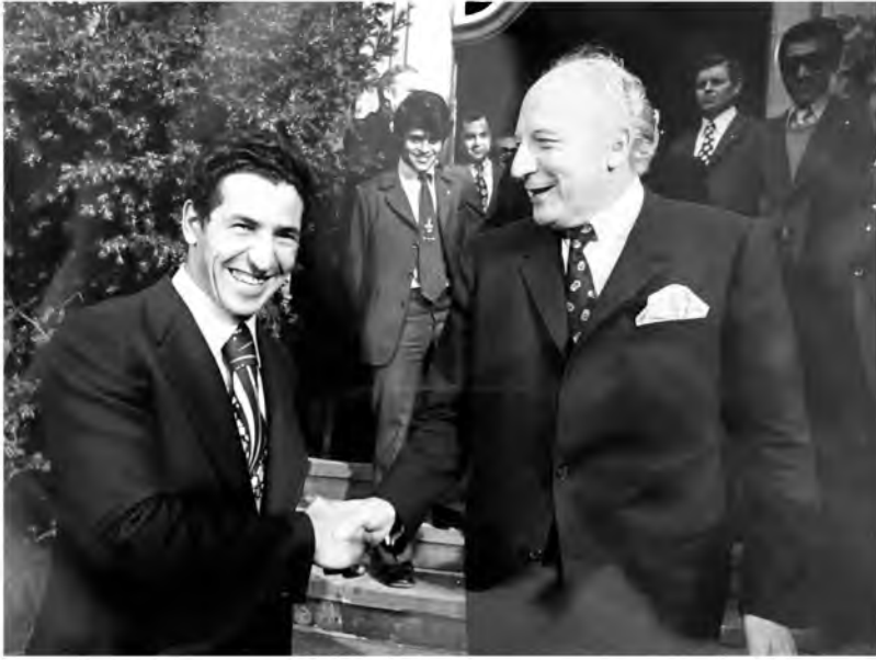
عبد السلام جلود مع وزير خارجية النمسا برونو كرايسكي، النمسا.